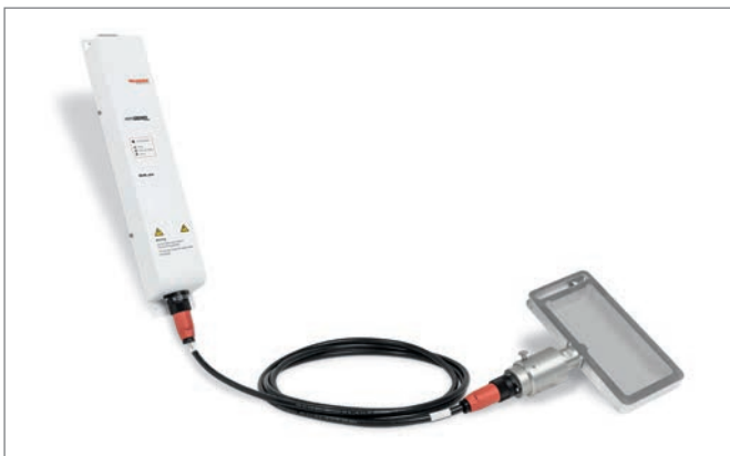
Vagliatura in circuiti della polvere con il generatore SG4L pro