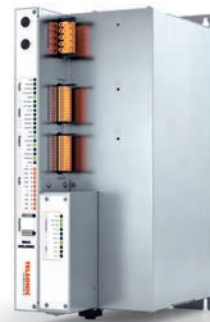
MAG 数字式超声波电箱