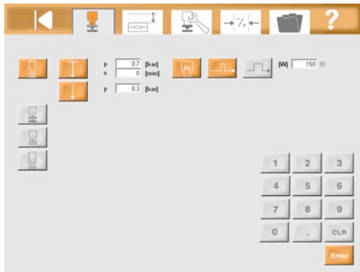
Bild Nr. 23-03 TC_MMI-Setup.jpg Setup- und Bedienfunktionen sind genauso wie Auswertungen zur Qualitätskontrolle intuitiv bildlich erfassbar.