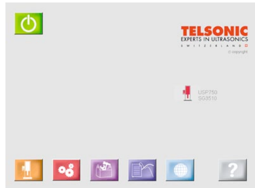
Bild Nr. 23-02 TC_MMI-StartMenu.jpg Grafische Symbole auf dem Touch Screen vermeiden Fehlbedienungen durch falsch übersetzte oder falsch verstandene Texte.