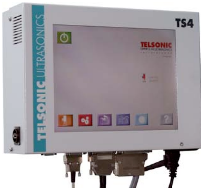
Bild Nr. 23-01 TC_MMI-TouchScreenTS4.jpg Kommt ohne Text aus: Die neue, intuitiv bedienbare Maschinensteuerung TS4 der Schweizer TELSONIC AG.