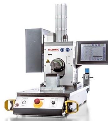
(Il sistema Telsonic per WMG include una saldatrice a ultrasuoni MPX50-1 per metalli con generatore serie SG22 e unità touchscreen TCS5)

La saldatrice per metalli MPX50-1 è in grado di esercitare una forza fino a 5000 N, con una corsa regolabile tra 1 e 50 mm. Una cella di carico completa e un sistema encoder lineare forniscono forza e feedback di posizione, visualizzabili assieme ai parametri del processo sul comando TSC5 con interfaccia grafica utente touchscreen. Il comando TSC5 offre varie modalità di saldatura, con finestre per il controllo qualità, controllo statistico del processo, interfaccia grafica utente intuitiva ed esportazione di dati grazie al software di Telsonic "TelsoTools", oltre alla comunicazione di rete.